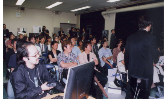
プロダクトセミナー/1号館