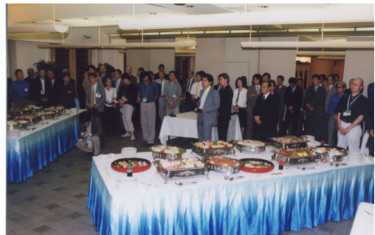
バンケット/ザ・スペース