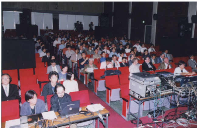
基調講演/サイエンスホール