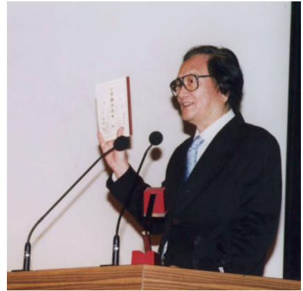
基調講演 講演者: 富田 勲氏