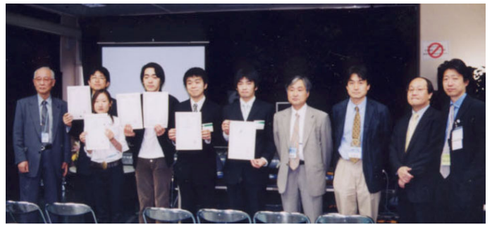
学生・若手エンジニアのためのサウンドアワード受賞者