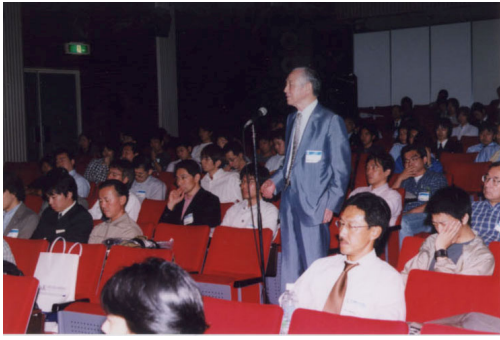
技術発表/サイエンスホール