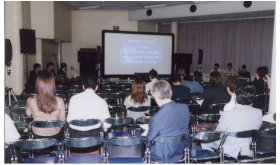
ワークショップ/6号館