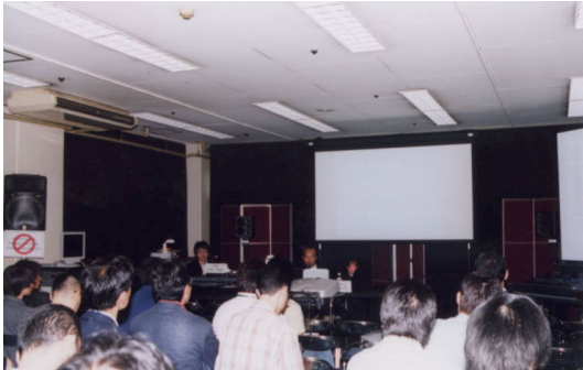
ワークショップ/11号館